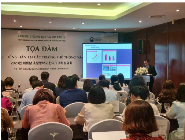
한국어교육 현황 및 비전