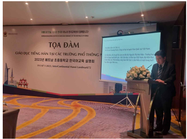
대사관 공사 인사말씀