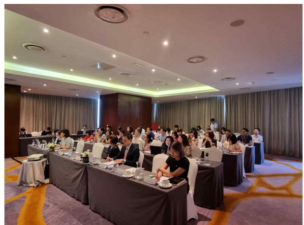
한국취업 등 사례 발표