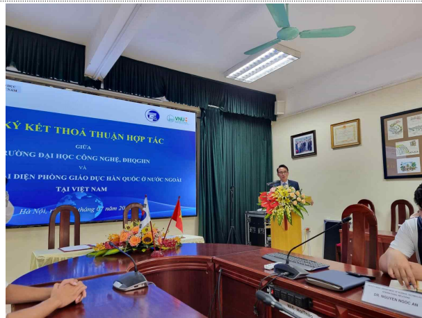
하노이국립대 공과대 총장 인사말씀