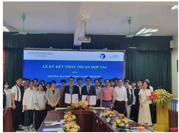
MOU 체결 및 개강식 기념사진